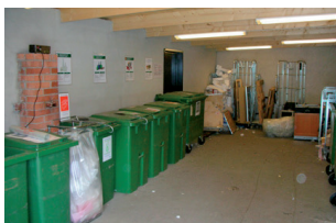
AirMaid® i soprum

AirMaid® W är en lätt mobil enhet som även fungerar som fast installerad. Med en miljövänlig och kostnadsbesparande teknik skapas tydliga luftförbättringar. Elförbrukningen är dessutom låg. Enkelt renas odörer från avfall, mat, rök, målfärg etc.