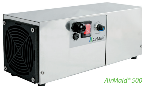
AirMaid® 500 W