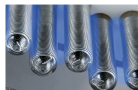
CGC "Corona Glass Cell"

CGC teknologin har funnits på marknaden sedan 1996.